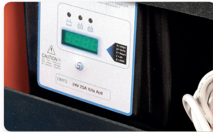
Carica batterie on board On-board battery charging Cargador de batería incorporado