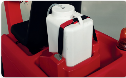
Dosatore detergente on board On board detergent dosing system Dosificación detergente a bordo