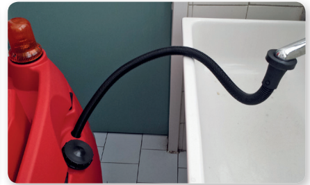
Tubo riempimento serbatoio Solutions filling hose Manguera llenado deposito