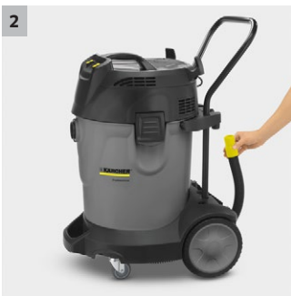
2 Nem at bruge