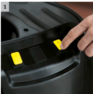
1 2 motorer

Kraftfuld våd-/tørsuger med 70 l beholder og op til tre motorer.