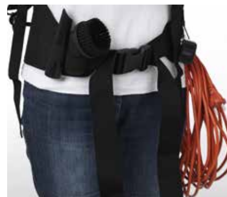
Tilbehør opbevares i bæltet, så det er nemt at få fat i