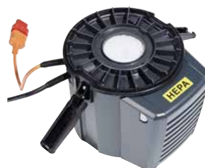
Let monteret HEPA-udblæsningsfilter som standard