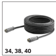
34, 38, 40